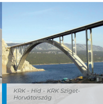
KRK - Híd - KRK Sziget - Horvátország