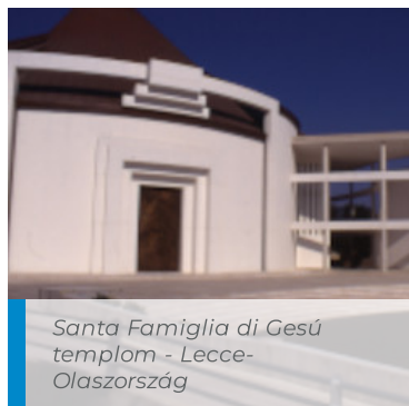
Santa Famiglia di Gesù templom - Lecce - Olaszország